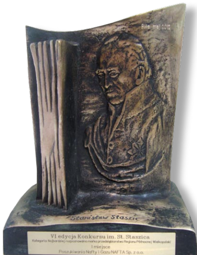
Statuetka St. Staszica dla Piłskiej NAFTY jako najbardziej rozpoznawalnej marki regionu.

Dla piłskiej NAFTY to jedno z najcenniejszych wyróżnień w całej jej ponad 50-letniej historii. To obiektywna ocena efektów przyjętej kilka lat temu strategii dynamicznego i zrównoważonego rozwoju firmy, jej polityki inwestycyjnej i dywidendowej jak też szerokiej dywersyfikacji rynków świadczonych wierceń naftowych (m.in. Egipt, Indie, Węgry). To także powód do sporej satysfakcji dla całej piłskiej społeczności naftowej.