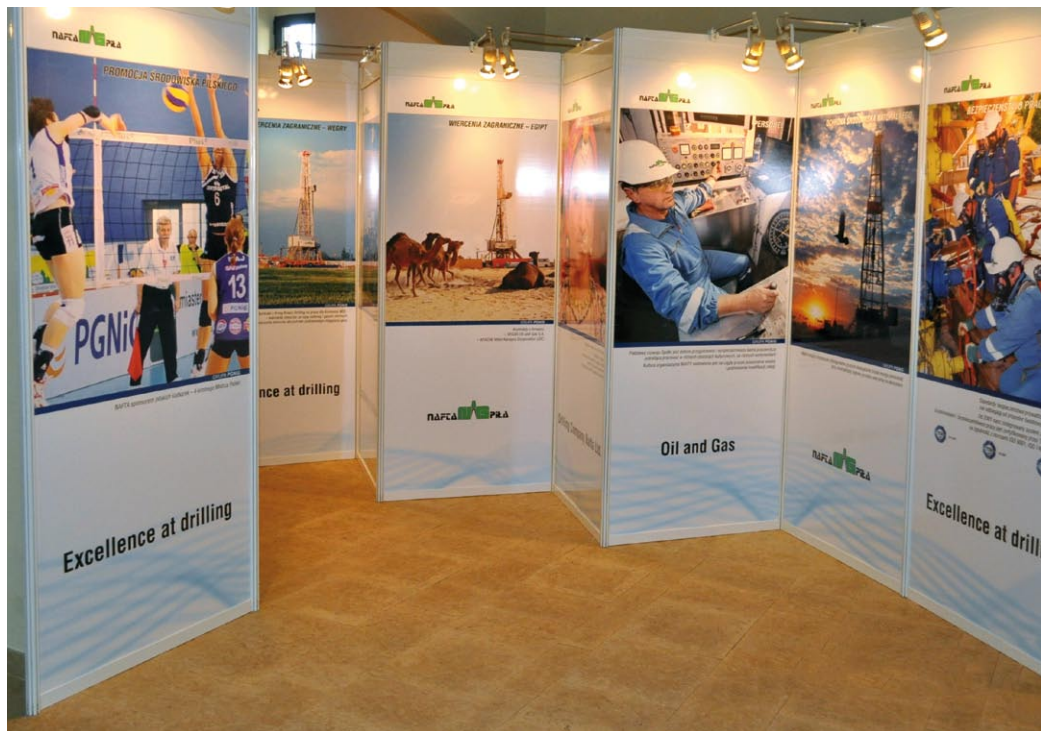
Wystawa „NAFTA Piła – Excellence at drilling”.