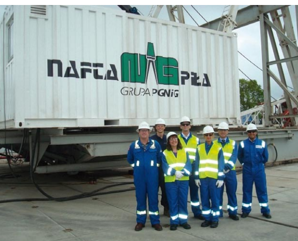
Nadzorujący wiercenia zespół Lane Energy/Conoco Phillips.

na wstępne określenie in situ potencjału gazonośnego łupków ordowicko-sylurskich.